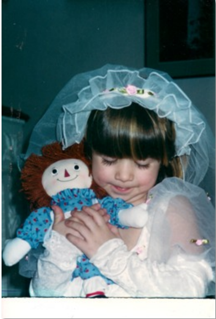
Con amigos ella jugaba “casa” y disfrazarse en vestidos muy bonita.