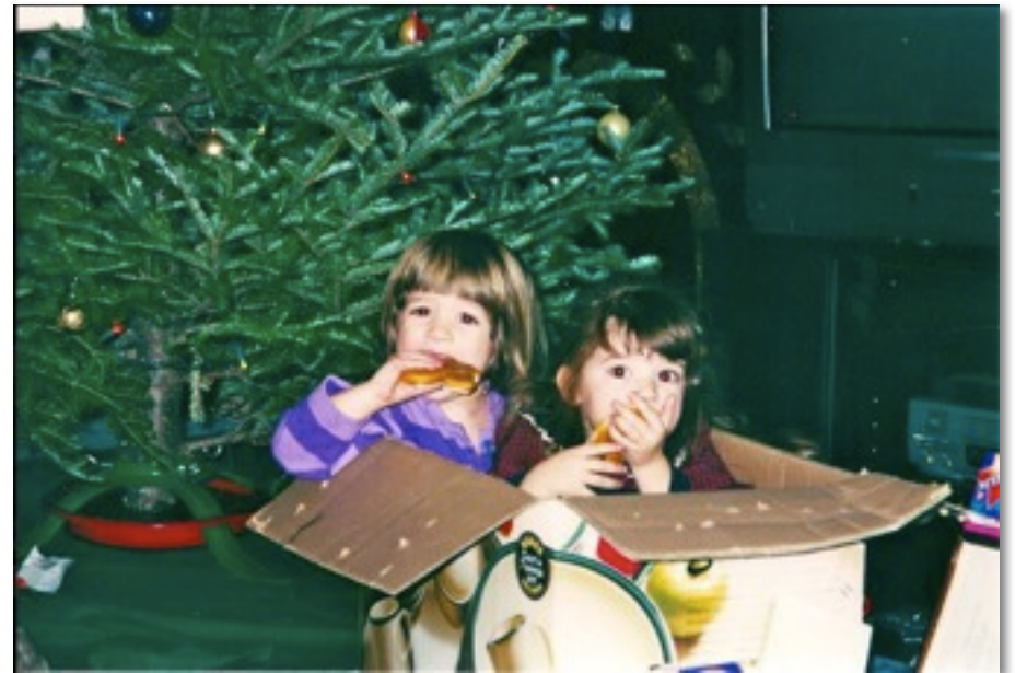
Ella gustaba fuera al cuerda.